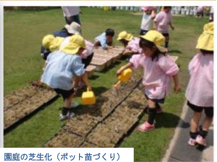
園庭の芝生化（ポット苗づくり）