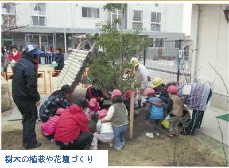
樹木の植栽や花壇づくり