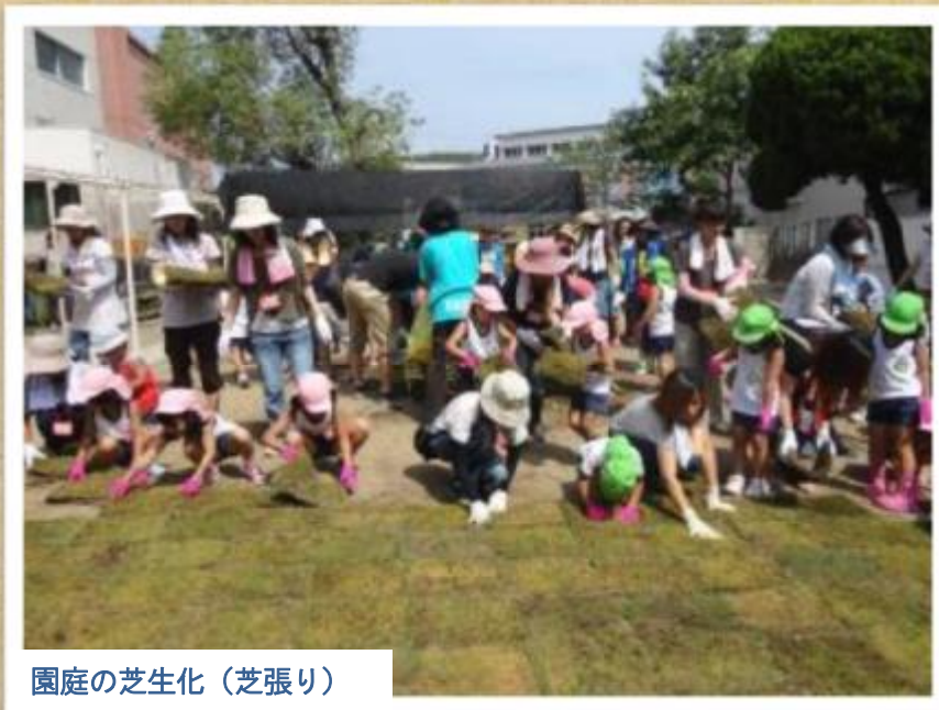
園庭の芝生化（芝張り）