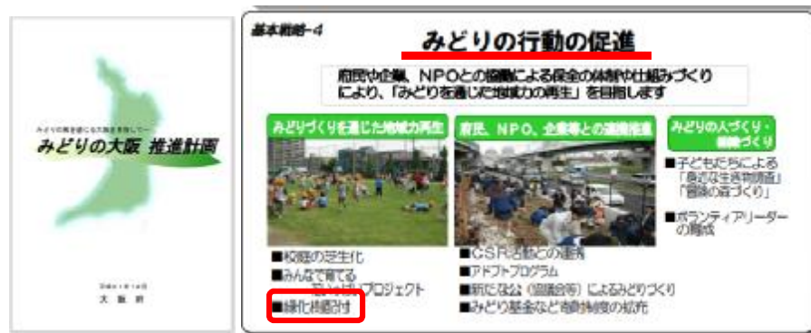
みどりの行動の促進（基本戦略4）を図る事業として位置づけ