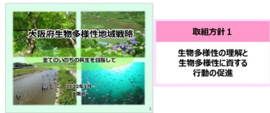
生物多様性の理解と生物多様性に資する行動の促進（取組方針1）を図る事業として位置づけ