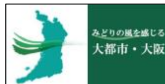
【みどりの風ロゴマーク】