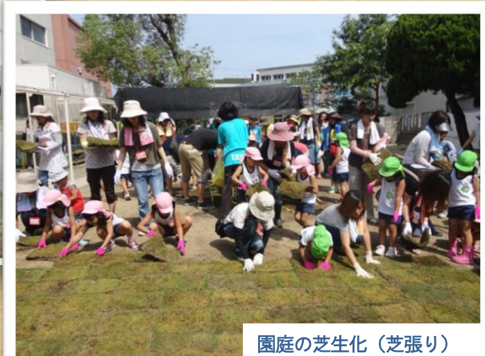
園庭の芝生化（芝張り）