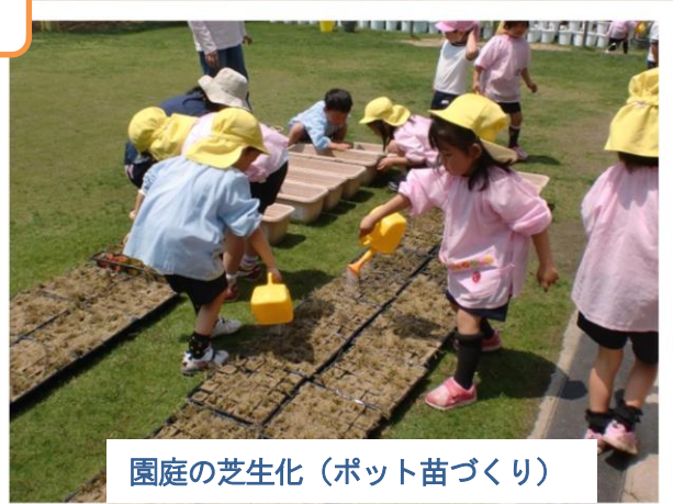
園庭の芝生化（ポット苗づくり）