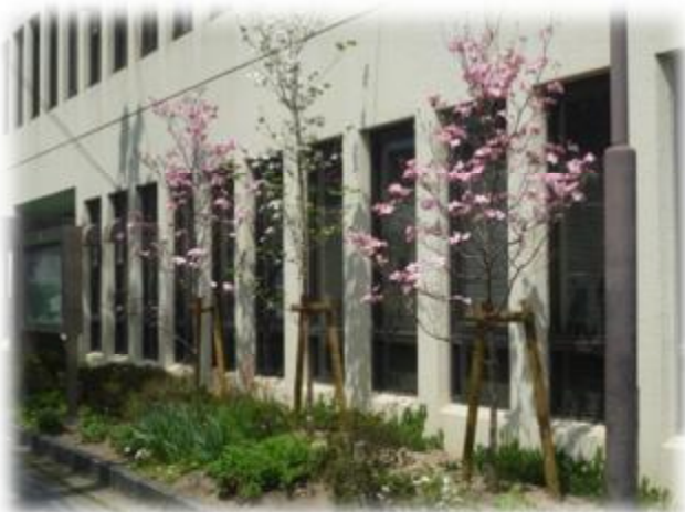
花の咲く高木を追加することで彩ある空間に