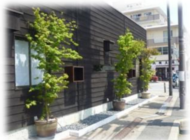
プランターを使用した緑化も可能