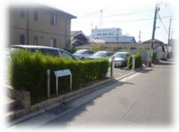
駐車スペースを減らすことなく駐車場緑化