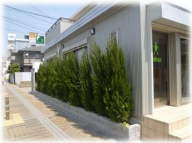
限られた空間を有効活用して緑視効果を高める