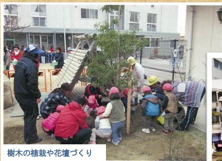
樹木の植栽や花壇づくり