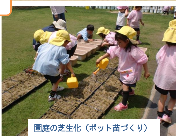
園庭の芝生化（ポット苗づくり）