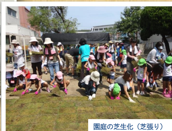
園庭の芝生化（芝張り）