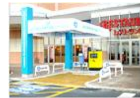
商業施設の乗客用駐車場での充電設備(イオンモールのりくう泉南店の急速充電設備)

➡ 大都市である大阪においては、基礎充電や経路充電の代替になる目的地充電(パブリック充電)を充実させることにより利便性を向上させるとともに、誰もが安心してEVを利用できる環境整備を推進していくことが必要。