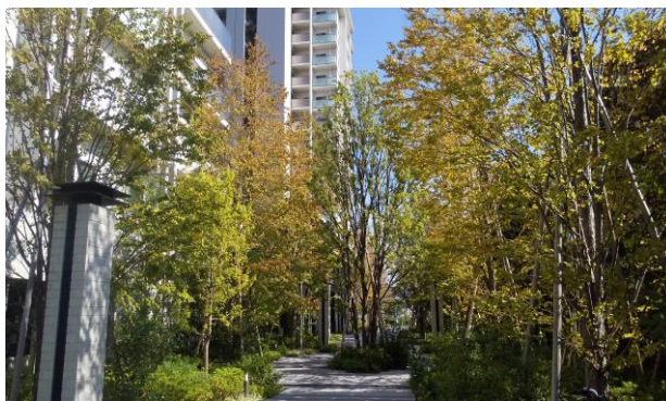
ローレルスクエア健都ザ・レジデンス