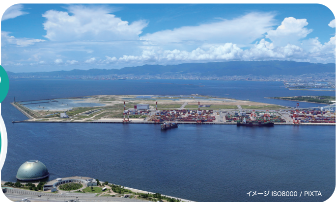
イメージ ISO8000 / PIXTA