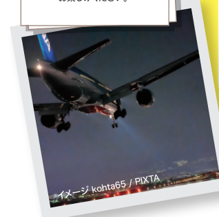
イメージ kohta65 / PIXTA

夜の神戸空港を離発着する飛行機を船上から見上げるように眺めることができます。迫力のある美しいシーンをお楽しみください。