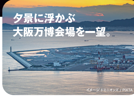
イメージドミニオンズ / PIXTA