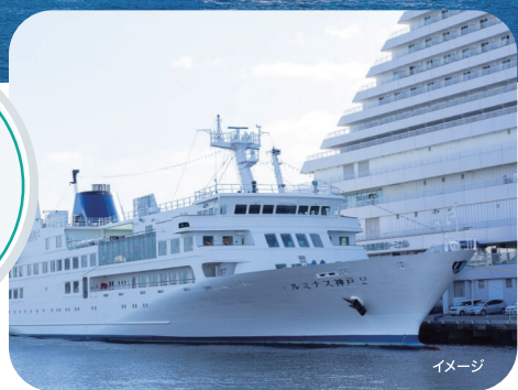
イメージ gandhi / PIXTA