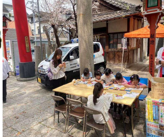
子ども向け防犯塗り絵コーナーの様子