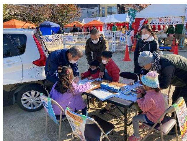
マルシェでの塗り絵ブースの様子