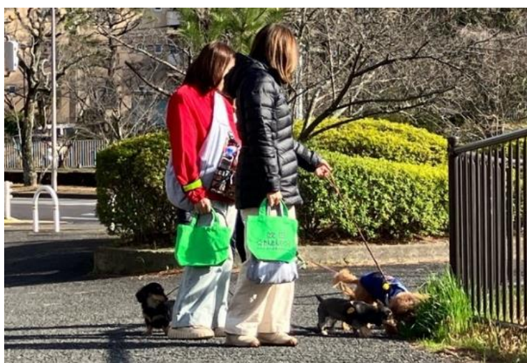
ながらパトロールの様子

防犯活動を通して飼い犬同士のコミュニティを形成、地域全体のマナーアップ、体感治安向上に寄与。