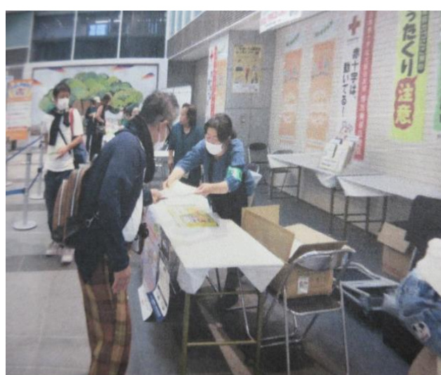
区民まつりでの啓発品配布の様子