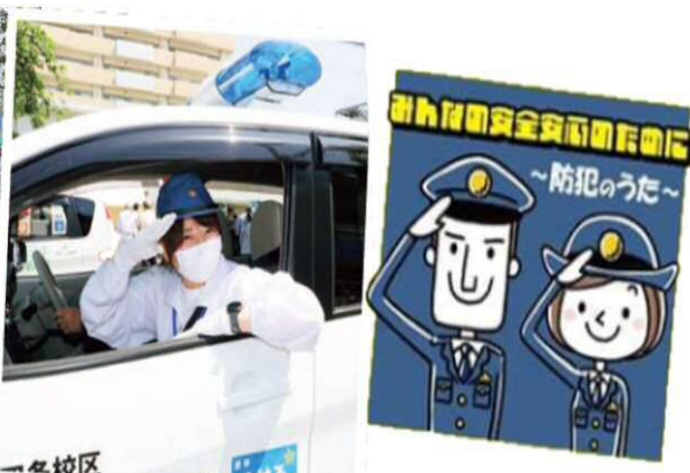
オリジナル防犯ソング