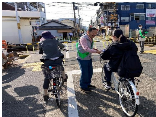
啓発用ティッシュの配布

ボランティアの固定化や高齢化、後継者不足が問題になっているなか、同団体の構成人員は124人。