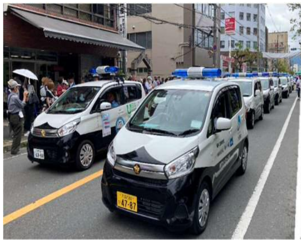
東大阪市ふれあい祭りの様子

枚岡防犯協議会が作成したパトロールカードを地元住民に配布、各種イベントでは青パト展示・防犯啓発ブースを出展し、子ども向け防犯塗り絵コーナーを設けて活動。