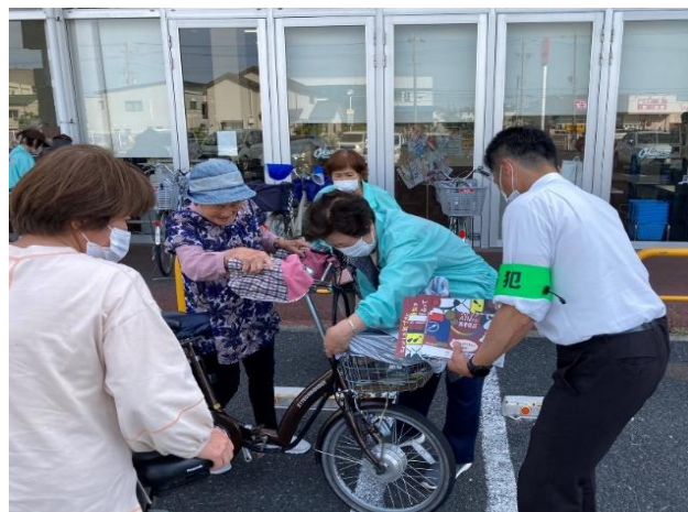
ひったくり防止カバーの取り付け