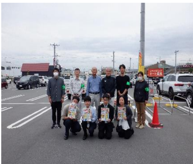
盗難防止ネジ取付けキャンペーン

警察、市役所だけでなく、初芝立命館高校インターアクトクラブの生徒とともに連携、被害防止のみならず、ボランティア団体の魅力を学生に発信し、後輩育成にも力を入れている。