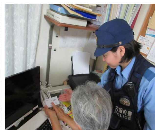
特殊詐欺対策機器の無料設置の様子