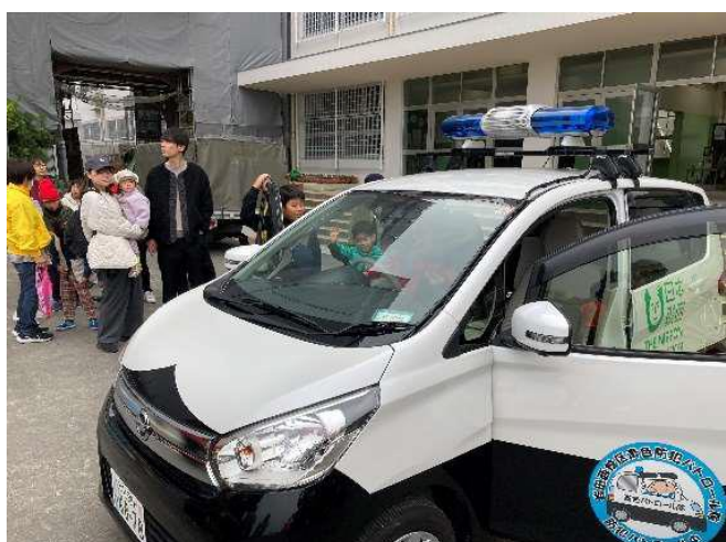
防災訓練での青パト車両試乗の様子