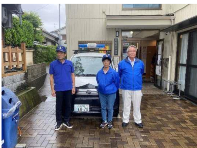
パトロール隊の皆さん