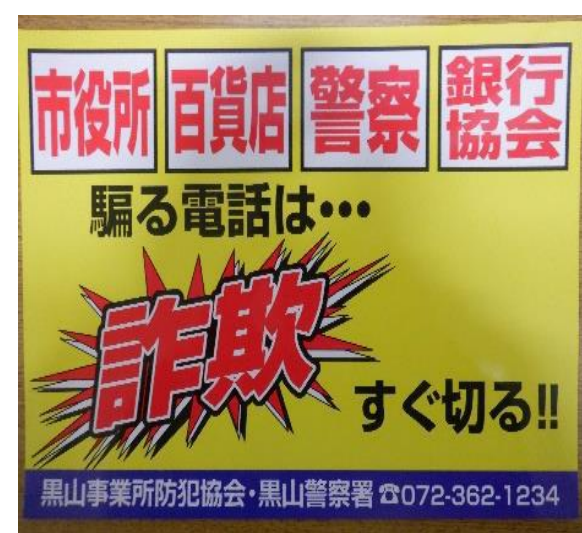
特殊詐欺注意喚起ポスター