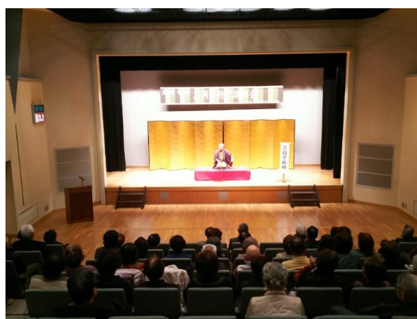
防犯講演会(防犯落語)