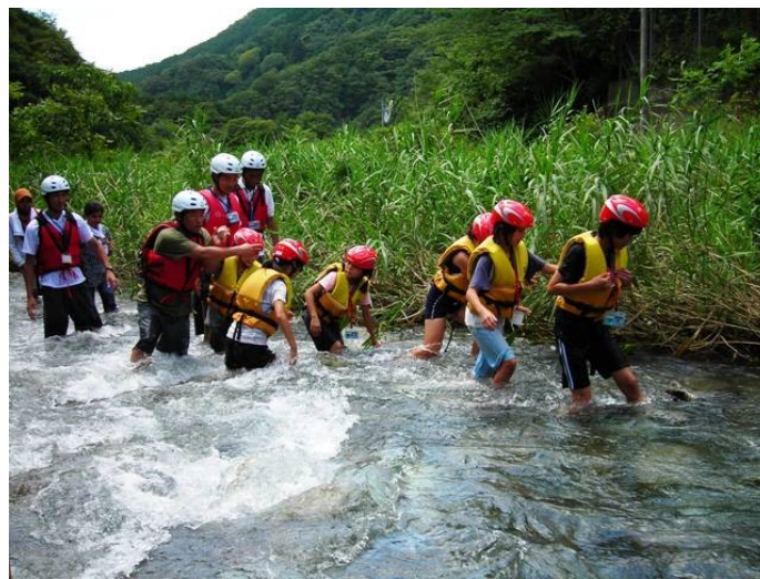
河川水難事故防止訓練 溪流歩き