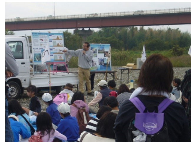
出前講座や安全 講習会の実施

(河川水難事故防止HP) http://www.mlit.go.jp/river/kankyo/anzen/index.html