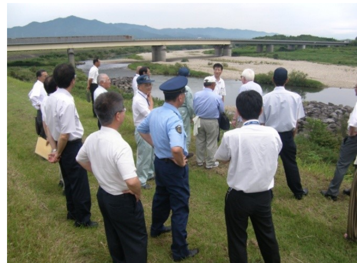
合同巡視 (水難事故防止連絡協議会)