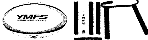
タグラグビーセット (60団体:対象は小学生以下)