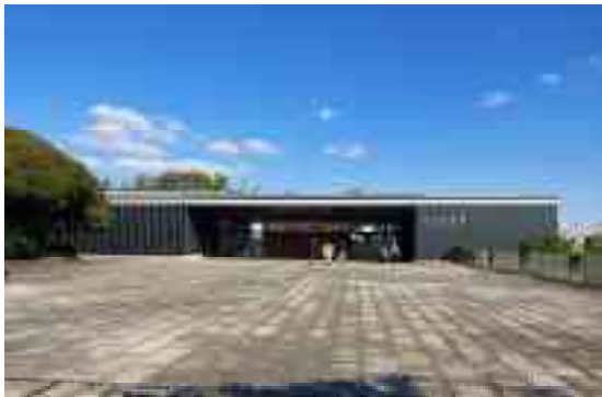
図 1-12 外観（西面）

展示室は、万博開催時から変わらず回廊式としており、展示ケースや休憩用の木製ベンチなども当時のものを使用している。また、建物には当時のスチール製のガラス戸やガラス窓などの建具が残り、現在も使用されている。