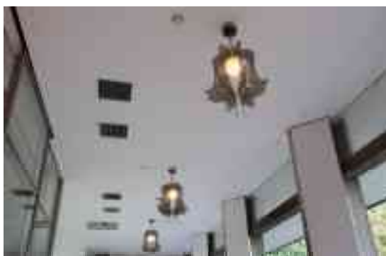
図 1-21 万博当時の照明器具