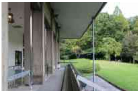
図 1-20 バルコニー