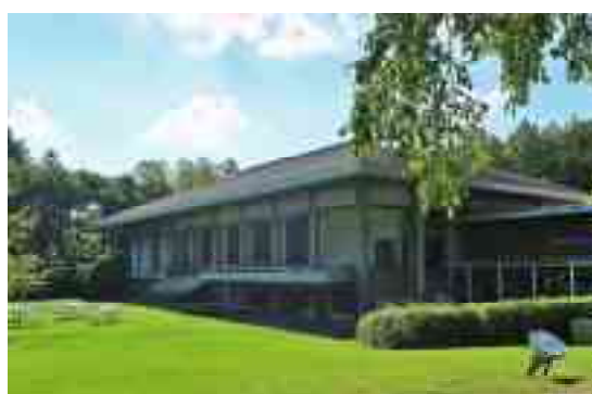
図 1-17 外観（東側）