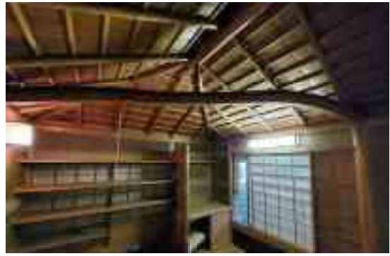
图 1-27 万里庵 水屋