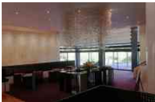
図 1-19 内部（ラウンジ）