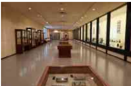
図 1-14 内部（展示室）