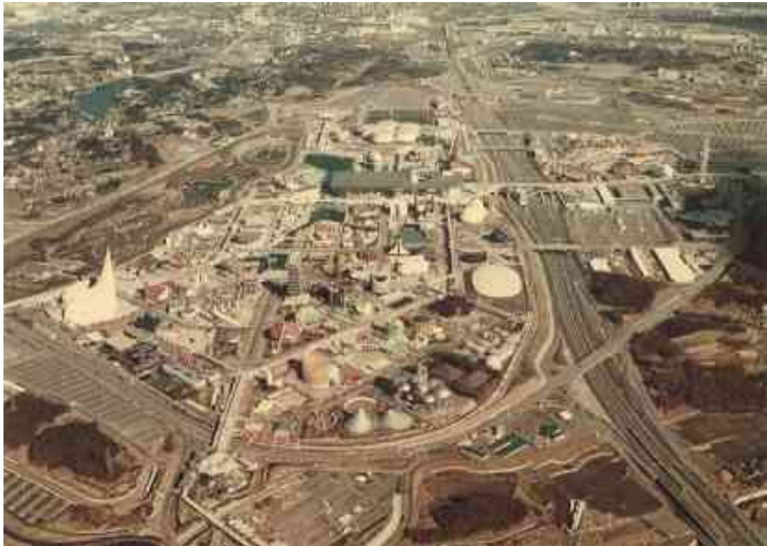
图 1-8 大阪万博全景（西側上空より撮影）