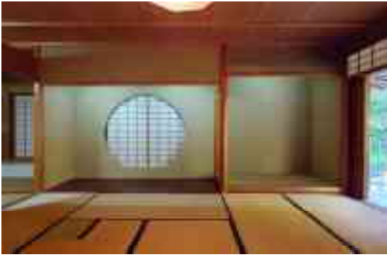
图 1-26 汎庵 広間