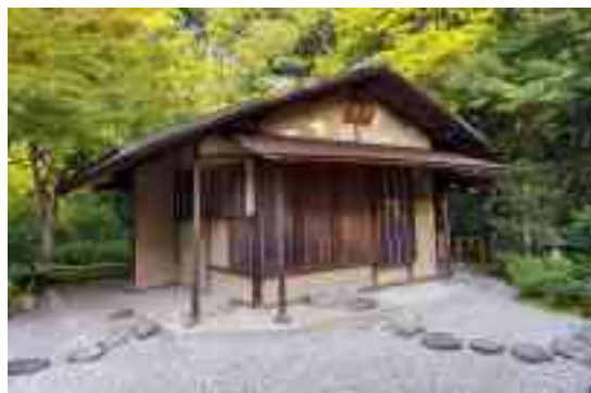
図 1-23 万里庵 外観