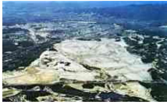
図 1-2 造成中の大阪万博開催予定地