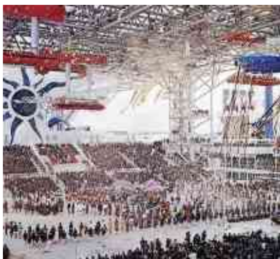
図 1-5 大阪万博開会式

会場は330haと広がったこともあり、場内の移動には、モノレールや動く歩道、ロープウェイなど当時の最新技術を活用した場内輸送装置が設けられていた。会期中は多くの来場者で賑わい、万国博史上最高となる入場者数6421万8770人を記録した。