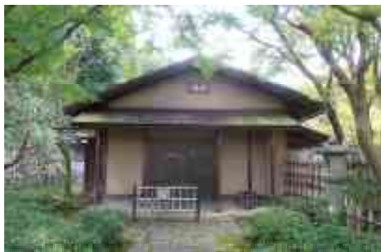
図 1-22 汎庵 外観

なお、茶室が建つ日本庭園は、令和 6 年（2024）6 月に国の登録記念物（名勝地関係）として登録されることが決まった。