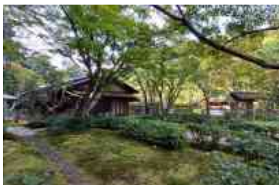
図 1-24 汎庵（左）と万里庵（右奥）