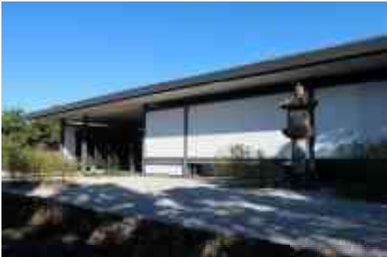
图 1-28 千里庵 外觀