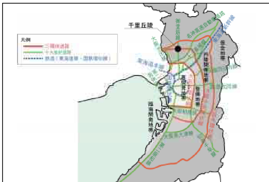
図 1-3 大阪地方計画（第1次報告、1962）による地帯構想図

大阪万博開催を目的とした関連事業のうち、交通機関としては道路整備、鉄道、空港、港湾などの整備・新設、環境整備としては、周辺地域の観光客増加を想定したホテル建設や公園の整備、河川・下水道の整備等が行われている。