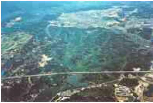
図 1-1 開発前の千里丘陵