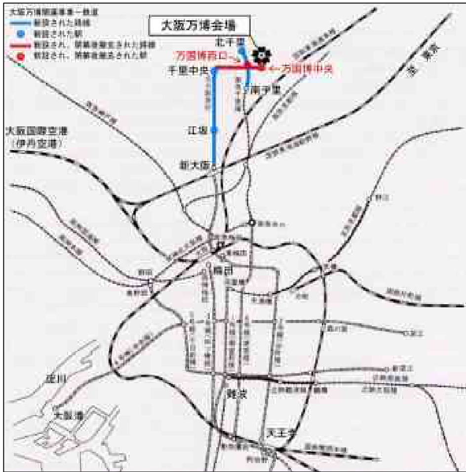
図 1-4 対象地周辺における鉄道計画図