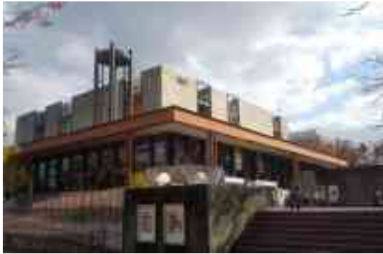
図 1-10 外観