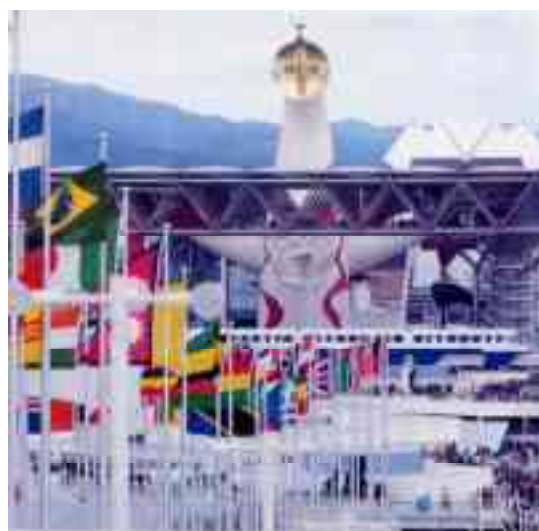
図 1-6 大阪万博会期中

太陽の塔はシンボルゾーンのなかでも中核を担う存在であり、ひいては大阪万博の象徴であった。また、テーマ展示のコンセプトである「人類の過去、現在、未来を貫き、空中に吹きあげるエネルギーの象徴」であるとともに、地下展示と大屋根の空中展示を結ぶ来館者用の動線としての役割を担った。太陽の塔は大規模な展示物であり同時に内部に展示空間を有するパビリオンでもある。大阪万博における単なる象徴としてだけでなく内部を展示空間として利用できるようにした極めて稀な巨大建築物である。