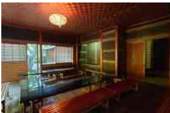
図 1-25 汎庵 立礼席