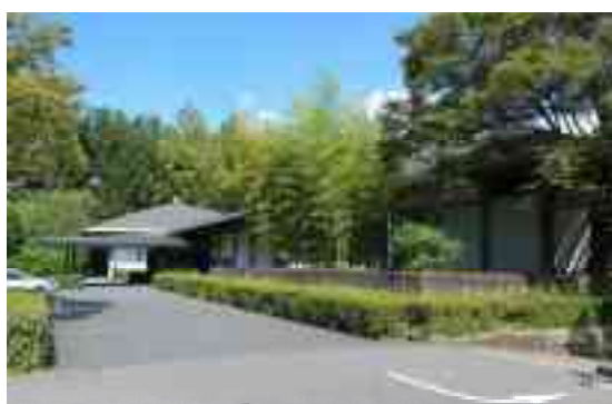
図 1-16 外観（西側 正面入口）

内部は入口を入ると天井高3.75mの玄関ホールとロビー・ラウンジが一体となった空間が広がり、ラウンジ脇の階段を上るとレセプションホールに続く。外部に面する壁面の大半にはガラスを採用しており採光を意識した明るい造りとしている。特に、迎賓館という用途から出入口付近の壁面に使用されるガラスには防弾ガラスを使用するなど安全面にも配慮したつくりとしている。建物は大阪府の所有であるが管理は民間企業が行っており、現在は結婚式場や宴会などで利用されている。