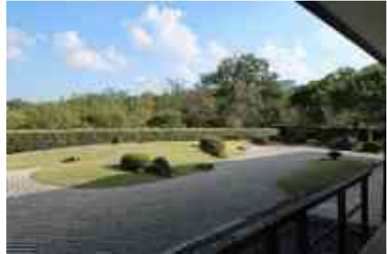
图 1-29 千里庵 枯山水