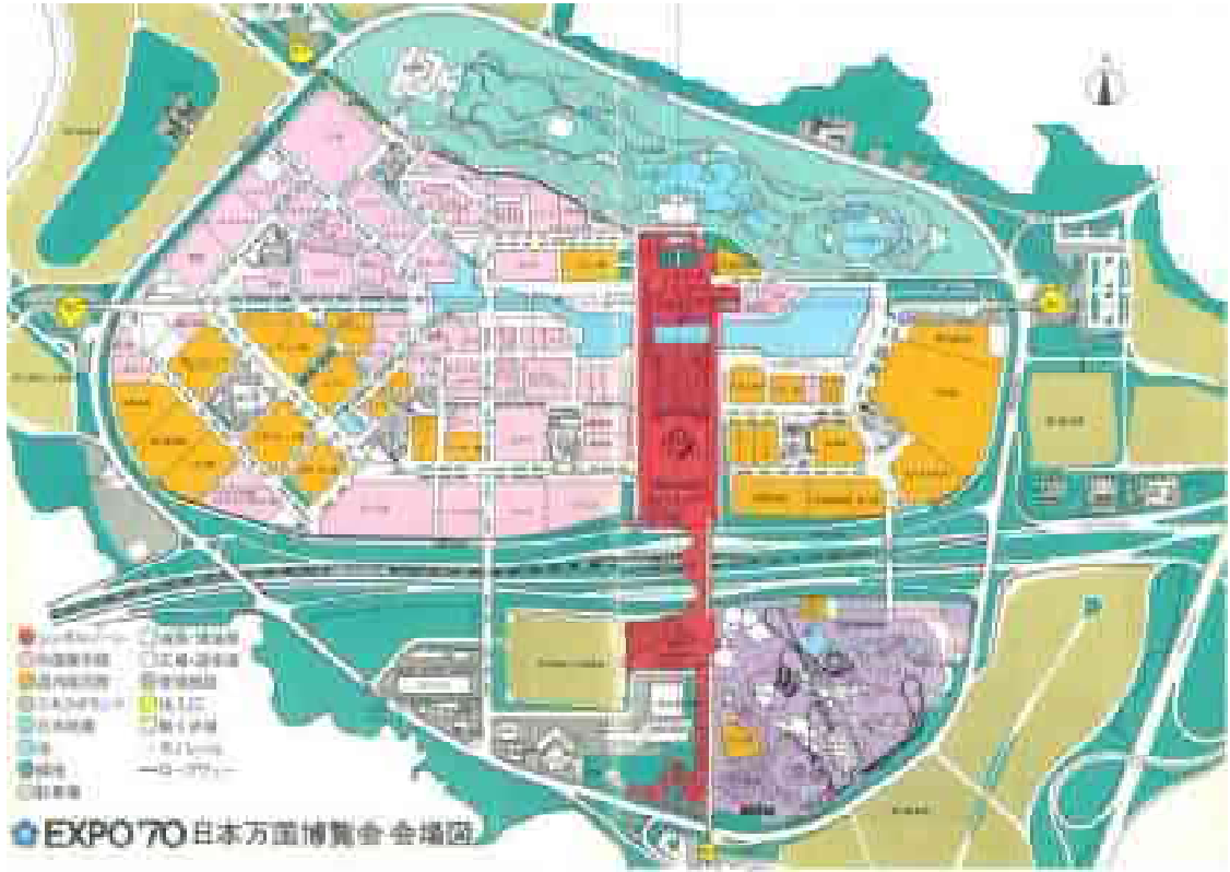
图 1-7 大阪万博会場図