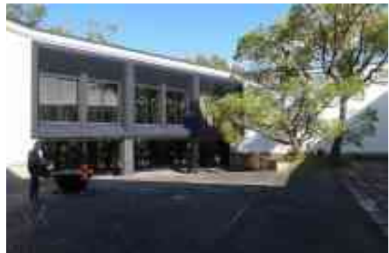
図 1-13 外観（中庭）