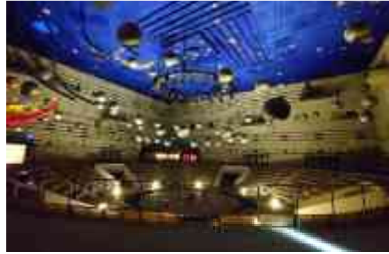
図 1-11 スペースシアターホール