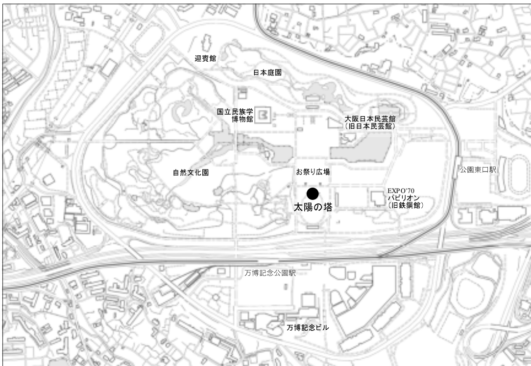
太陽の塔 位置図 (大阪府吹田市千里万博公園 41-1)