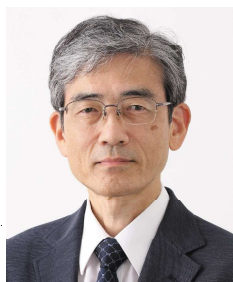
村田 路人 (むらたみちひと)

筑波大学卒業後、製薬会社を経て2002年からNHKキャスターとして活動。2006年に気象予報士登録。現在はWWFジャパン顧問、NPO法人気象キャスターネットワーク理事長として、気候変動問題に関する講演や委員活動等で活躍。