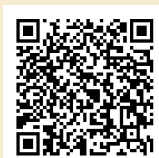
お申込みフォーム