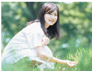
井田 寛子 (いだひろこ)

筑波大学卒業後、製薬会社を経て2002年からNHKキャスターとして活動。2006年に気象予報士登録。現在はWWFジャパン顧問、NPO法人気象キャスターネットワーク理事長として、気候変動問題に関する講演や委員活動等で活躍。