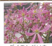
ダイヤモンドソウ 10月下旬～11月上旬