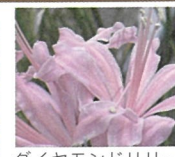
ダイヤモンドリリー 10月下旬～12月上旬