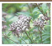
フジバカマ 9月下旬～10月中旬