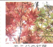
モミジの紅葉 11月下旬

※本誌に掲載の植物、動物は天候・生育状況により変更することがございます。予めご了承ください。🕒 時間 💰 料金 ※2024年関西文化の日以外、全プログラム別途入園料が必要です。📍 場所