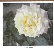
バラ 10月中旬～11月中旬