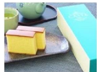
カステ21(株式会社銀装)