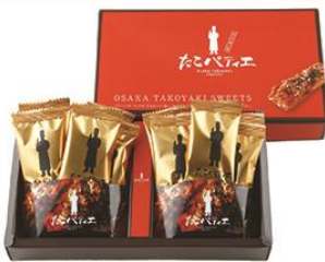
たこパティエ(株式会社瓢月堂)