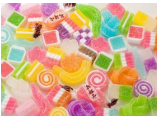
お好みゼリー(みどり製菓株式会社)