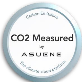
アスエネCFP算定ラベル (ASUENE)