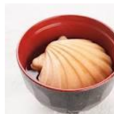
懐中志る古(御菓子司亀屋茂廣)