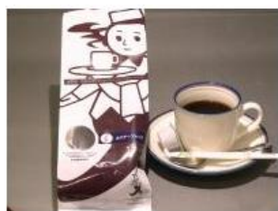
深焼きホリデーコーヒー(田代珈琲株式会社)