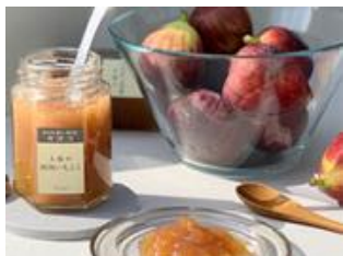
大阪の河内いちじくジャム(株式会社南千総)