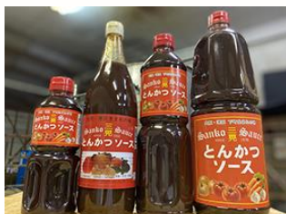
三晃とんかつソース(三晃ソース株式会社)