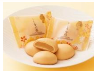
月化粧(株式会社青木松風庵)