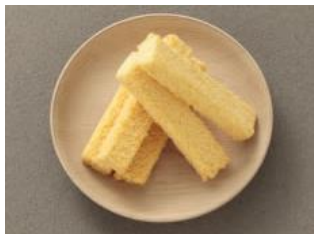
カステララスク(株式会社長崎堂)