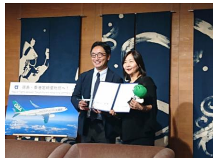
徳島～香港間の定期便就航に向けた 共同宣言書の締結(R6.7)

双方向の人的交流拡大、 若者の海外体験の機会を得る後押しのため 渡航のハードルを下げる必要