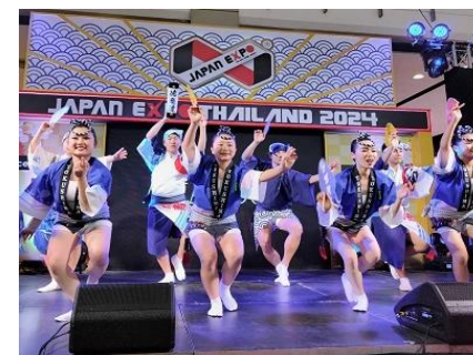
JAPAN EXPO THAILAND 2024 徳島県内学生による阿波おどり