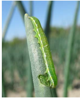
図 3 ネギの葉を加害する