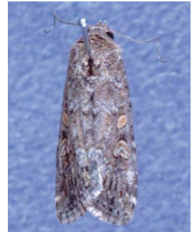
図 4 シロイチモジヨトウ成虫