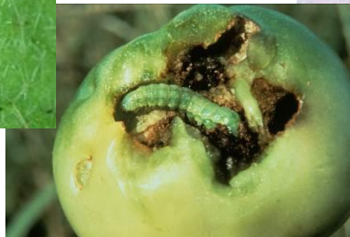
図3: オオタバコガ幼虫