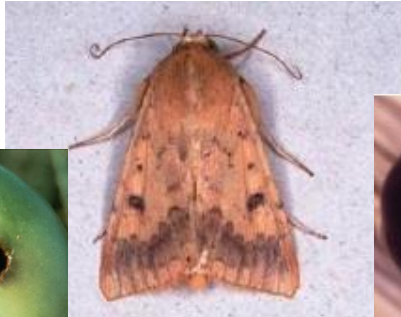
図4: オオタバコガ成虫