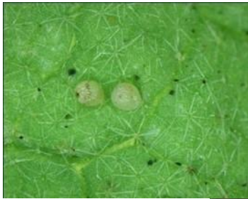
図2: オオタバコガ卵

幼虫が蕾や果実に穴をあけて食入するのが特徴である（図5）。大阪府内での作物への被害は、6～10月まで続く。8～9月の被害が最も多い。