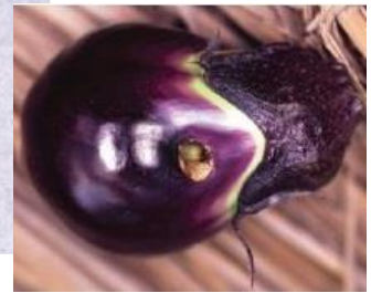
図5: 水なすの食入痕