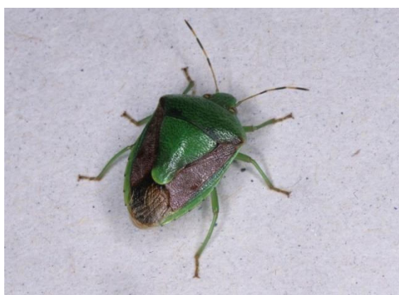
▲チャバネアオカメムシ