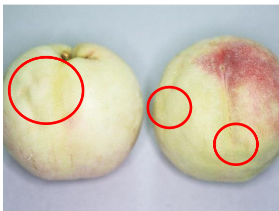
▲ももの被害(果実表面がデコボコになる:丸印が被害箇所)