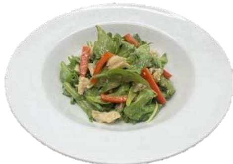
泉州きく々とチキンのサラダ