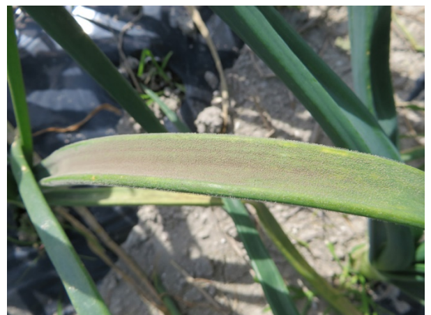
図 3 ベト病の被害葉 蔓延の原因となる暗紫色のかび