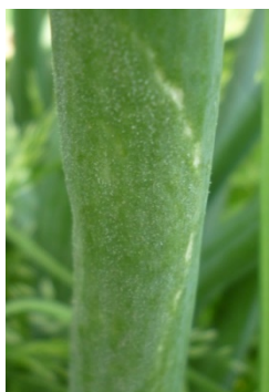
図 1 ベト病の被害葉 発生初期の霜状のかび

注3 ベトファイター顆粒水和剤、プロポーズ顆粒水和剤に含まれる成分ベンチアバリカルブイソプロピルの総使用回数は 3 回以内なので注意する。