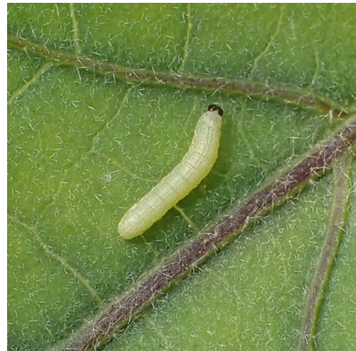
図2 なすの葉を加害する若齢幼虫