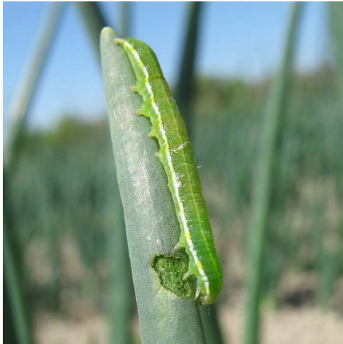
図1 ねぎを加害する老齢幼虫

本年5月中旬以降、シロイチモジヨトウのフェロモントラップの誘殺虫数が、各地で平年を上回った。 昨年9月にも注意報を発表しており、近年注意が必要な害虫である。