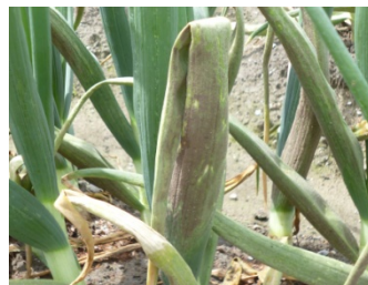
写真 3（2次感染株・激発時）