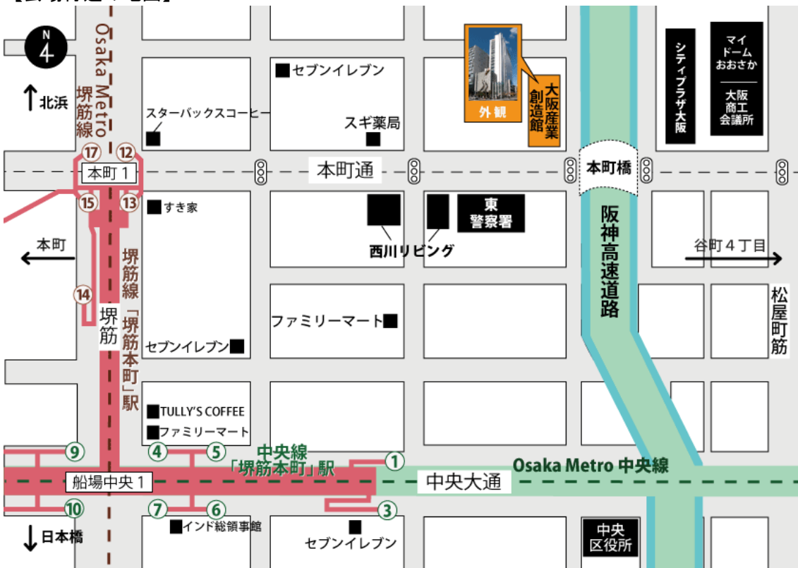
Osaka Metro 中央線・堺筋線「堺筋本町」駅下車 徒歩約5分