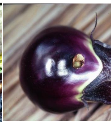
写真1 オオタバコガ(卵) 写真2 オオタバコガ(幼虫) 写真3 被害果(水なす)