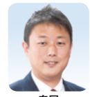
自民 うらべ 走馬 (茨木市)

Q 女性防災リーダーの育成にあたっては、具体的な育成目標数の設定が必要。 A 府域全体の状況を把握した上で、目標設定に向けて、市町村と意見交換してまいります。