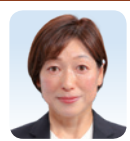
公明 堀川 裕子 (八尾市)

Q 教育長は現在の府の教育行政や施策の課題に対して、どのように対応していくか。 A これまでの経験を活かしプロモーション推進と不登校の子どもの包括的支援に取組む。