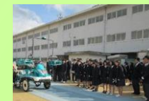
高校への出前授業