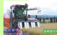
スマート農業のカリキュラム強化