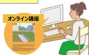
オンライン講座のコンテンツ作成・提供