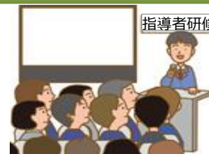
研修機関の指導者向け研修や学生向け研修の実施