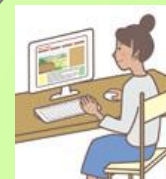
eラーニングの導入