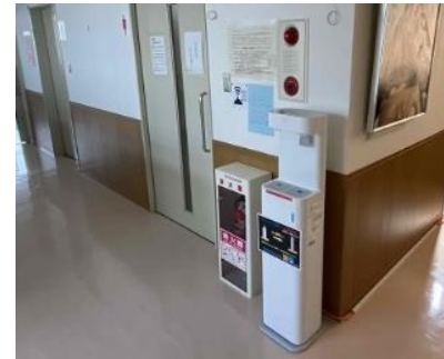
吹田市岸一地区公民館 2F階段正面 無料給水スポット