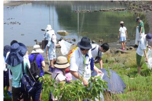
大阪湾エコバスツアー (R元.8)

小学生と保護者を対象に、大阪湾を巡りながら環境学習を行うバスツアーを開催し、参加者に対し、マイボトルをプレゼント