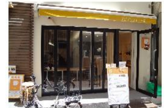
給茶スポット