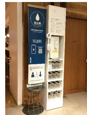
（右）大阪城公園 JO-TERRACE OSAKA （エレベーターホール）