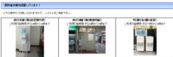
府ホームページ 給水場所