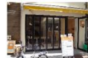
給茶スポット（象印ホームページ）