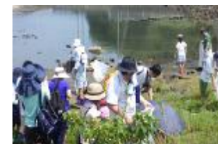
大阪湾エコバスツアー（R元.8）

小学生と保護者を対象に、大阪湾を巡りながら海洋プラスチックごみ問題などの環境学習を行うバスツアーを開催し、参加者に対し、マイボトルをプレゼント