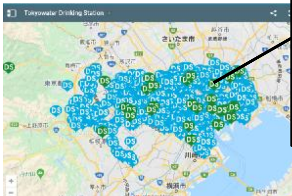
東京都水道局 給水マップ