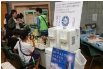
啓発ブース@ECO縁日(R元.11.3)

給水機の水で、香りのついたフレーバー水を参加者がつくって、マイボトルへの給水を楽しんでもらうコーナーを設置