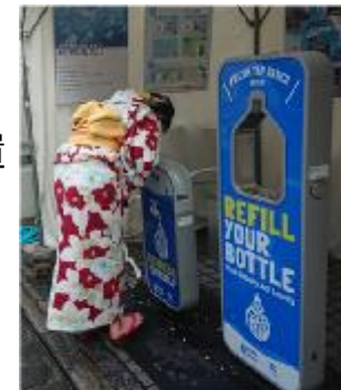
天神祭における給水スポット設置