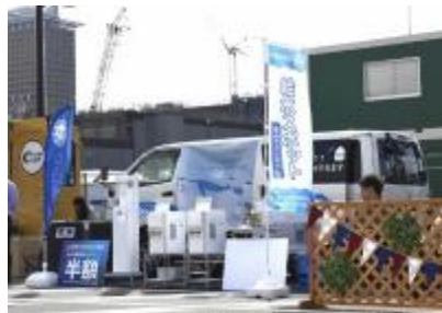
レッツゴー万博2025@大阪城公園(R元.11.16)