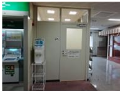
府庁別館1F 無料給水スポット