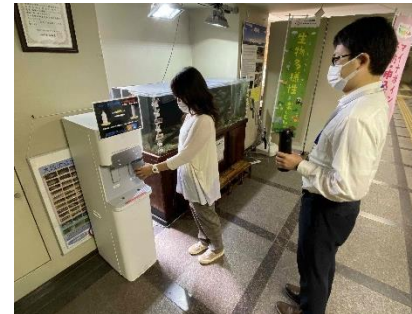
吹田市本庁舎1階 まちなか水族館横 無料給水スポット