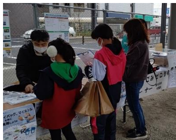
海洋ごみを知ろう！スポGOMI大会in いずみおまつ2020(R2.12.4)