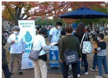
□ハスフェスタ万博2020Autumn @大阪万博記念公園(R2.11.7.8)