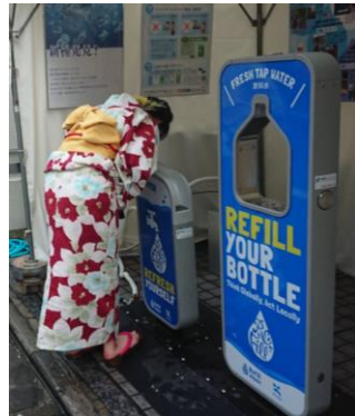
天神祭における給水スポット設置