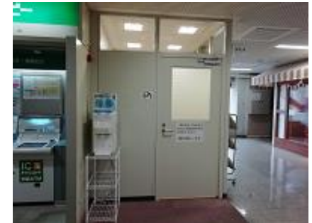
府庁別館1F 無料給水スポット