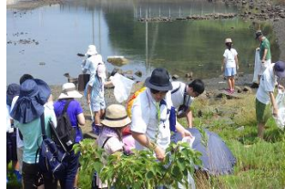
大阪湾エコバスツアー（R元.8）

小学生と保護者を対象に、大阪湾を巡りながら環境学習を行うバスツアーを開催し、参加者に対し、マイボトルをプレゼント