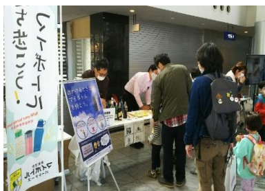
啓発ブース@咲洲こどもEXPO2020 (R2.11.7.8)

〈BRITA・イオン・タイガー・象印・ウォーターネット・ウォータースタット・ピーコック〉