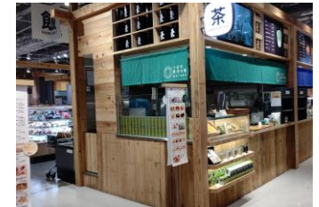
給茶スポット (茶寮つぼ市製茶本舗NODATE)