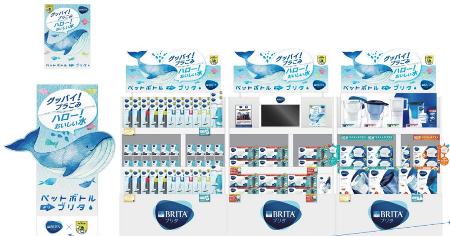
※スタンドサインPOPは2パターンの想定。