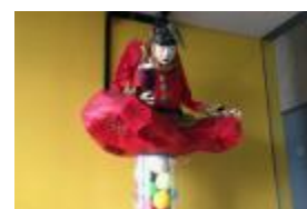
多彩な造形探索 これは何か？ これはどこに？