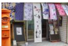
ANYアート・ワークショップ 紙や布など手近な素材で