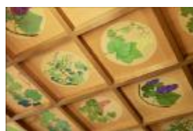
Anyアート・ツアー 柏原のアート資源の探索 地域の歴史・文化