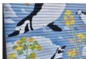
Anyアート・ツアー 商店のシャッターアート まちを楽しく・明るく