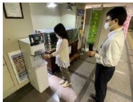
吹田市本庁舎1階 まちなか水族館横 無料給水スポット