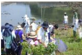
大阪湾エコバスツアー（R元.8）

小学生と保護者を対象に、大阪湾を巡りながら環境学習を行うバスツアーを開催し、参加者に対し、マイボトルをプレゼント