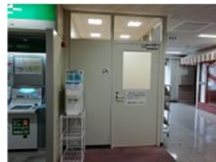
府庁別館1F 無料給水スポット