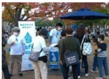
ロハスフェスタ万博2020Autumn @大阪万博記念公園(R2.11.7.8)