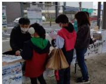
海洋ごみを知ろう！スポGOMI大会in いずみおまつ2020(R2.12.4)