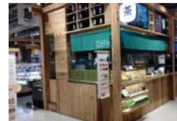
給茶スポット (茶寮つぼ市製茶本舗NODATE)