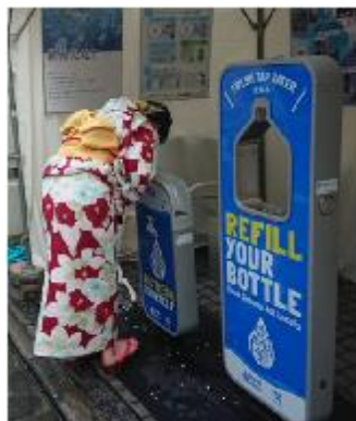
天神祭における給水スポット設置