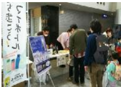
啓発ブース咲咲洲こどもEXPO2020 (R2.11.7.8)

〈BRITA・イタノ・タイガー・象印・ ウォーターネット・ウォータースタンド・ピコック〉