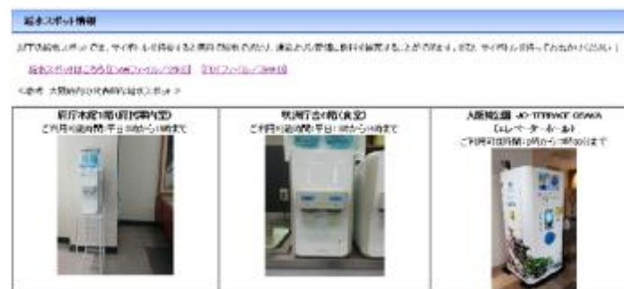
府ホームページ 給水場所

(上) 給水場所を公表することにより、各種給水マップの登録をすすめます。 (左) 給水スポット名や場所、利用可能時間などが一目でわかります。