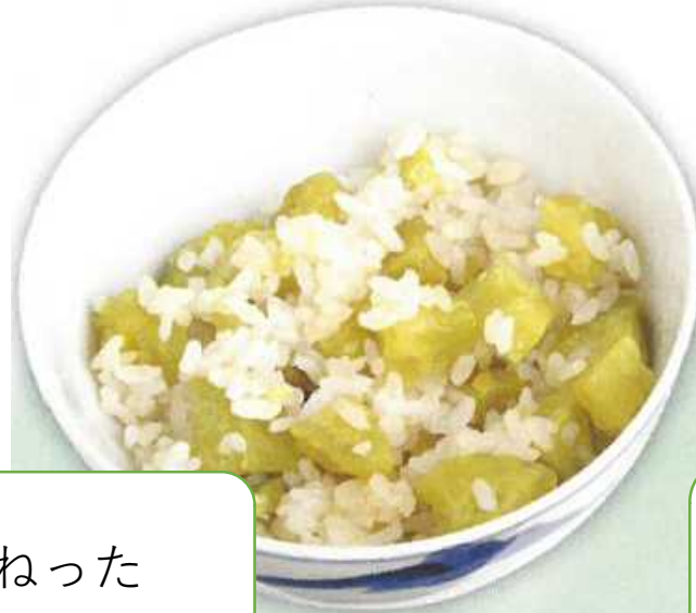
いもごはん 麦や「ひえ」など 入れてかさまし