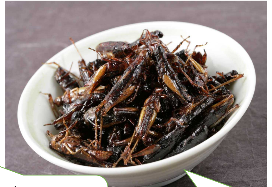
いなごのつくだに 一生けんめい つかまえた