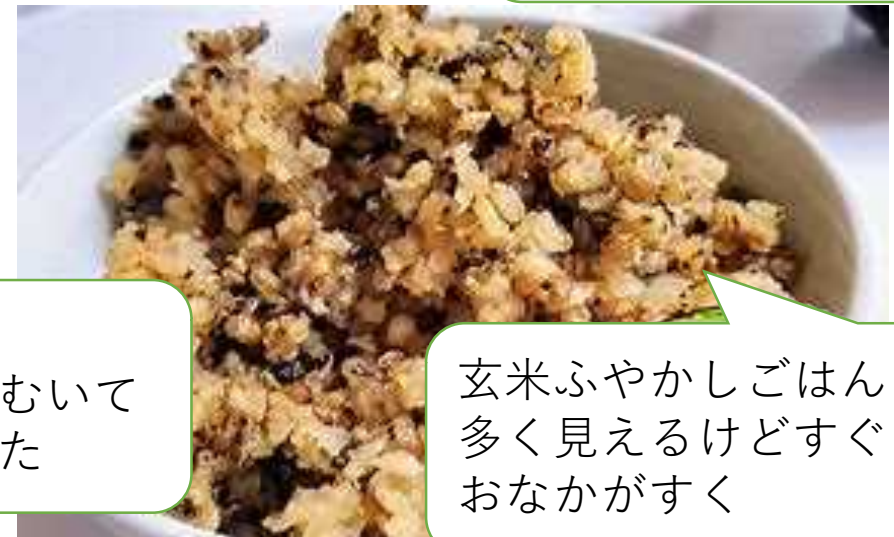
玄米ふやかしごはん 多く見えるけどすぐ おなかがすく