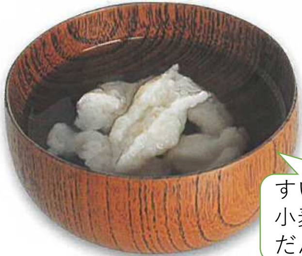
すいとん 小麦粉をねった だんご汁