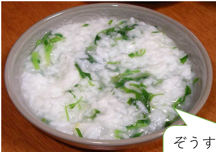
ぞうすい 食べられる草をつ んで入れた