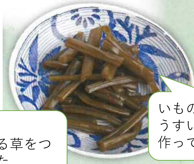
いものつる うすい皮をむいて 作ってくれた