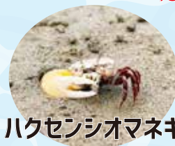
ハクセンシオマネキ