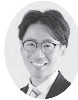
1977年大阪生まれ。成器高校、近畿大学卒、平野民主商工会勤務、元大阪市議(2期・8年)家族は妻、子2人、加美小学校元PTA会長