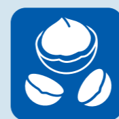
マカダミアナッツ