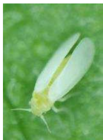
タバココナジラミ ※