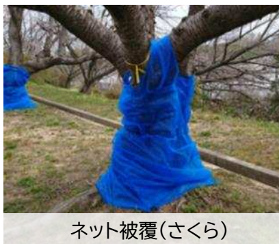
ネット被覆(さくら)