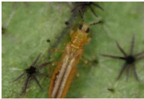
ミナミキイロアザミウマ成虫※