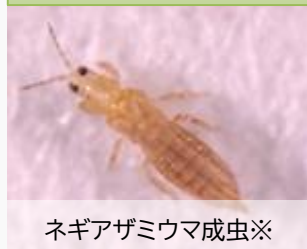
ネギアザミウマ成虫※