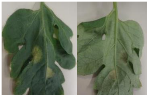
すすかび病被害葉※ 表(左) 裏(右)※