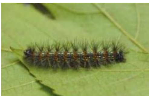
クワゴマダラヒトリの幼虫※