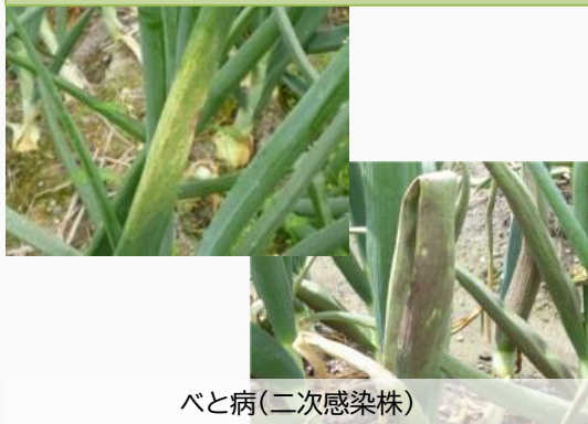
べと病(二次感染株)