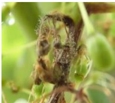
灰色かび病の症状