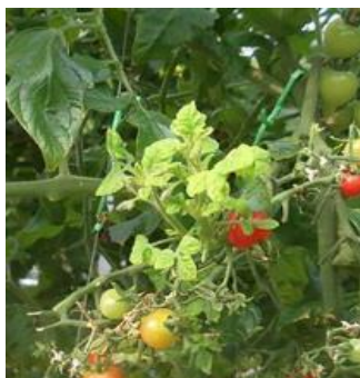
トマト黄化葉巻病発症株