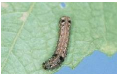
ハスモンヨトウの幼虫*