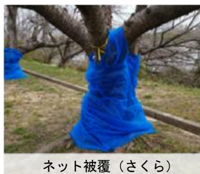
ネット被覆（さくら）