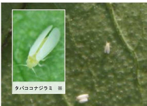
タバココナジラミ ※