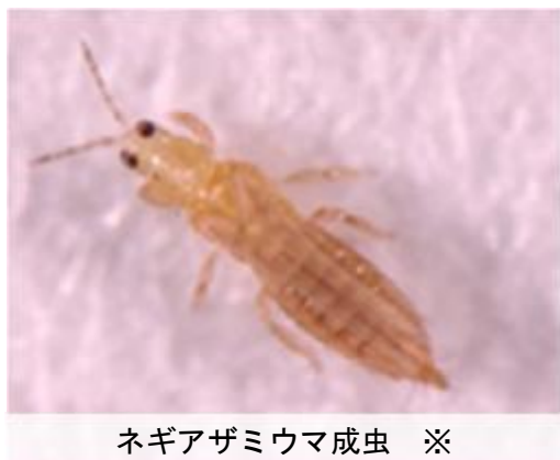
ネギアザミウマ成虫 ※