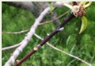
せん孔細菌病春型枝病斑