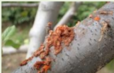
クビアカツヤカミキリ被害樹