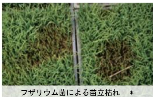
フザリウム菌による苗立枯れ *