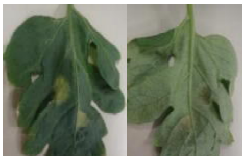
すすかび病被害葉※ 表（左） 裏（右）※