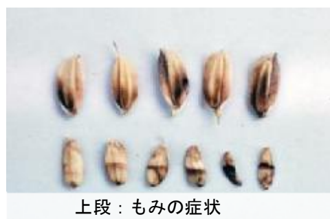
上段：もみの症状 下段：玄米の症状 ※