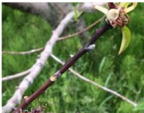
せん孔細菌病の春型枝病斑