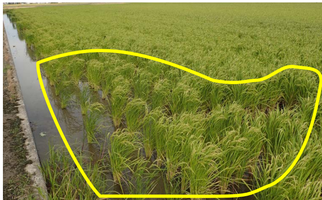
▲食害され、欠株を生じた水田