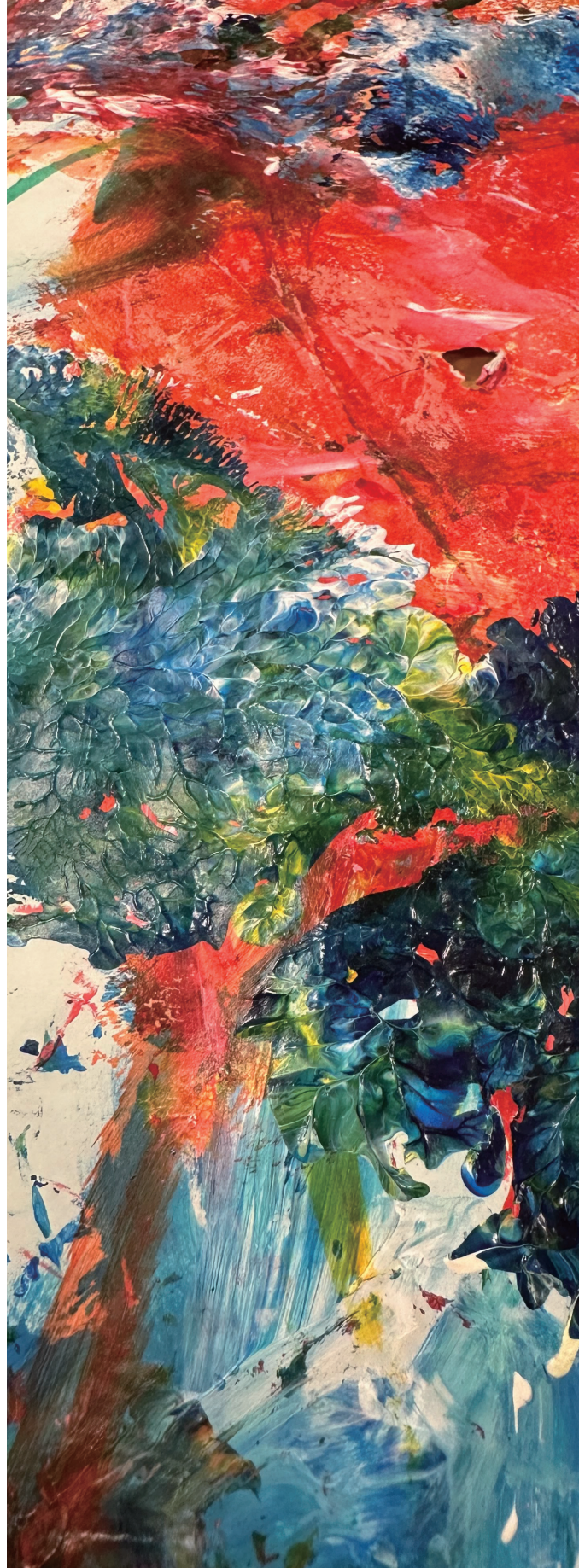
四天王寺和らぎ苑 (部分)

この事業は、大阪府の委託事業として国際障害者交流センター ビッグ・アイが実施します 令和6年度厚生労働省障害者芸術文化活動普及支援事業