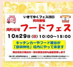
R5年度イベントチラシ