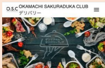
R3、4年度 デリバリーシステムサイト