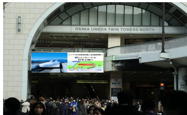
阪急大阪梅田エントランスビジョンなど デジタルサイネージ