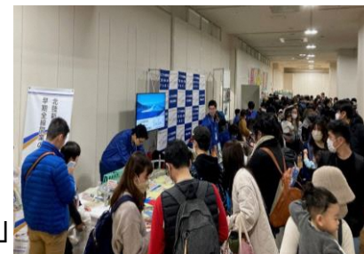
ブース出展 「鉄道博2024」