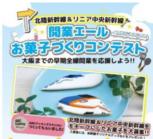
開業エール お菓子づくりコンテスト (令和3年度実施)