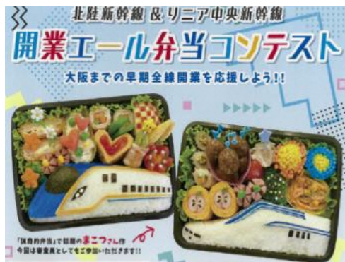
開業エール 弁当コンテスト (令和2年度実施)