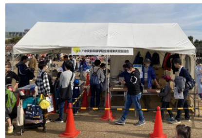
ブース出展 「万博鉄道まつり 2023」