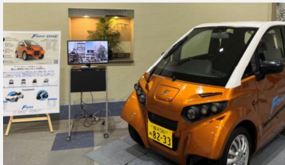
世界最小クラスの4人乗り電動車の特別展示（協力：(株)FOMM）