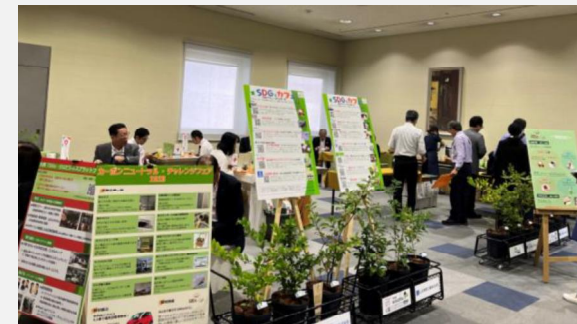
2023年度「SDGsカフェ」の様子