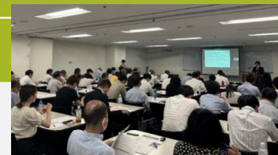
セミナー&個別相談会 会場の様子

6月 セミナー&個別相談会「グローバルな視点から見た、カーボンフットプリントの現状と今後の取り組み」開催 ➔ 246人が参加。個別相談も3社・団体から申込があり、事業者と調整した