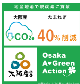
大阪版CFPラベル（大阪府）