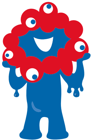
大阪・関西万博公式キャラクター ミyakumiyaku ©Expo 2025