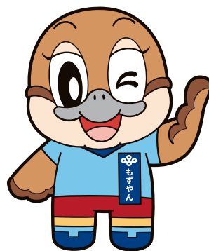
大阪府広報担当副理事 もずやん