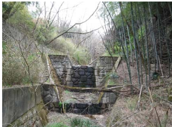
1号えん堤下流溪流保全工