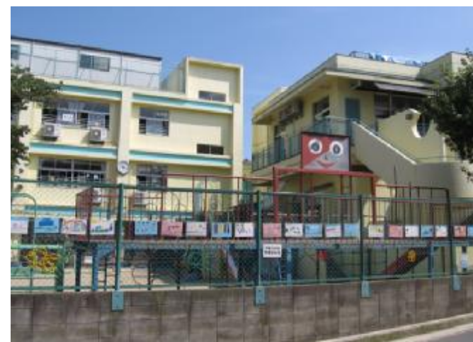
要配慮者利用施設 (保育園)